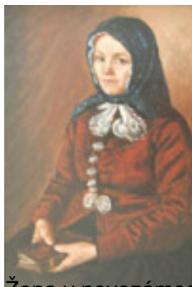
Žena v novezámeckom kroji, olej, DM-365