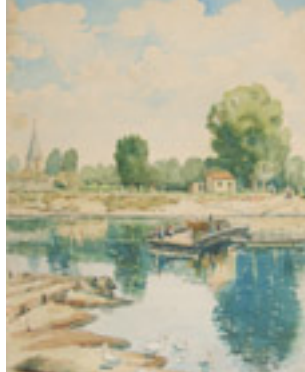
Brod pri Zempnom, akvarel, DM-378