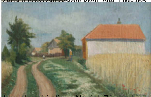
Jeruzalemská ulica v Nových Zámkoch, olej, DM-376