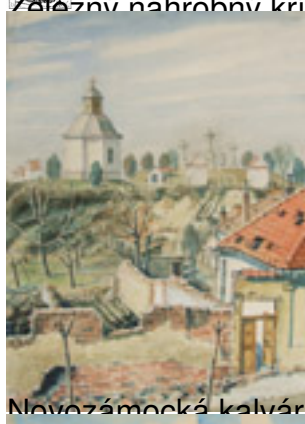
Novozámecká kalvária, akvarel, DM-377